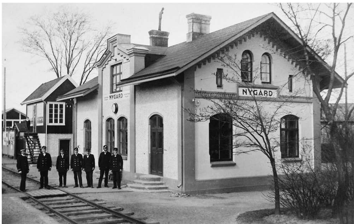
Nygårds station ca 1910

Stationshuset revs under första delen av 1970-talet.