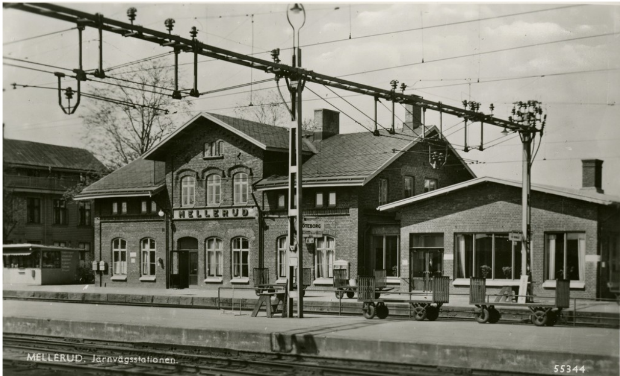
Mellerud station 1955