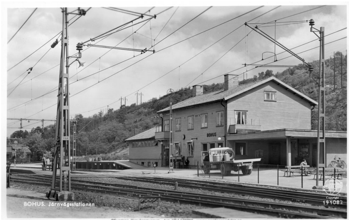
©Sveriges Järnvägsmuseum - Jvm_KDAA00763 - www.samlingsportalen.se Bohus station på 1950-talet (Foto från Sveriges Järnvägsmuseum http://www.samlingsportalen.se/getitem-record?PID=SE_SJM_FG_Jvm_KAFF00464 )