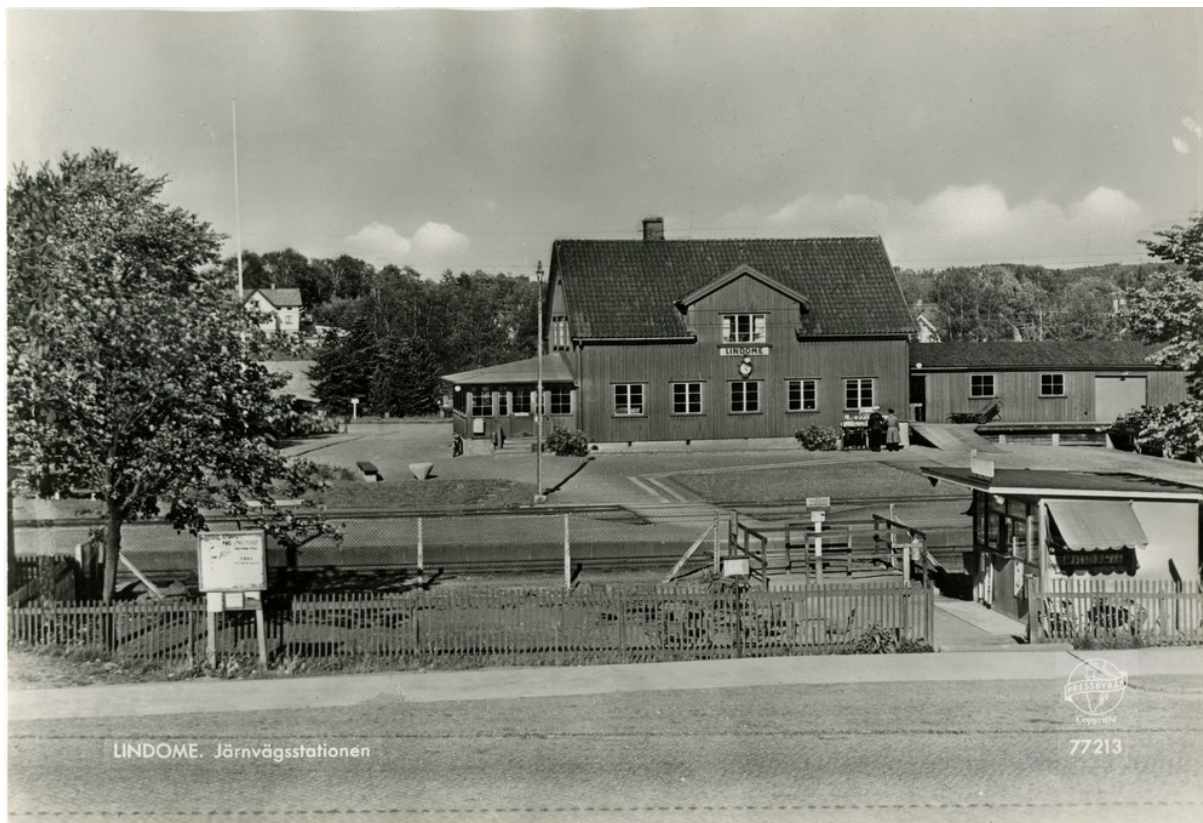
Lindome station kring 1950 Järnvägmuseet, KDA05306